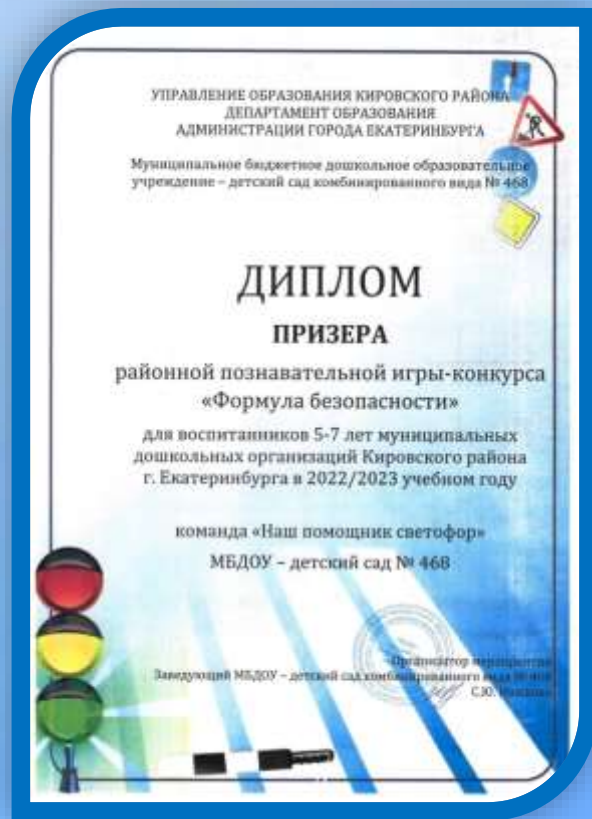
Создание видеоролика для участия в районном конкурсе «Формула безопасности»