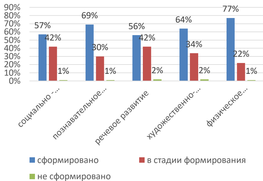
Результаты мониторинга освоения АОП ДО в 2023-2024 учебном году